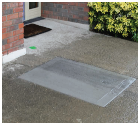
施工后：混凝土地面永久恢复。