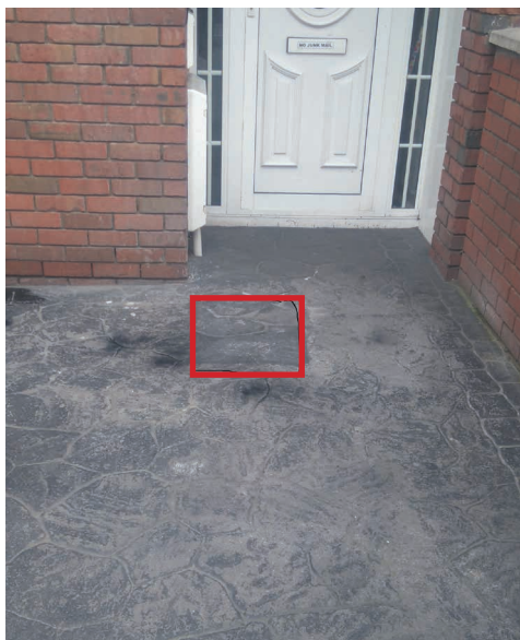
压印混凝土地面的临时恢复。

爱尔兰燃气管网有限公司会千方百计地保护您居所的花盆和草地不受损坏。跟您协商时，我们会选择最佳路径，避免损坏植物、花和草坪。不过，你最好临时移走植物和花，以免因意外情况而受损。我们也会小心对待草地，但也许难免踩踏到草坪或其边缘，尤其是在天气差的情况下。如果在开挖作业期间，草地受损，那么我们的工作人员会尽力修复，如有必要，还会包括补种。因季节原因，对花盆和草地的修复可能会延后。