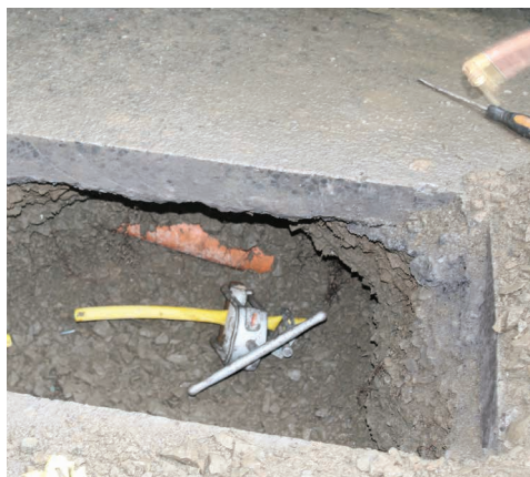
施工中：私家混凝土车道明挖。

若未提前通知您，我们不会移表。如要重新预约，请打我们电话 1800 427 737。