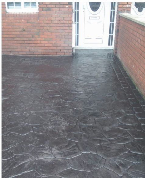
压印混凝土地面的永久恢复。