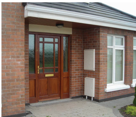
Exemple d'un compteur dans une zone qui pourrait être enfermée.

Les frais entrepris pour ces travaux seront effectués gracieusement mais il faut cependant bien noter qu'il y aura une coupure momentanée de votre alimentation en gaz.